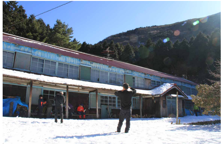
▲ 雪の積もった丸山荘