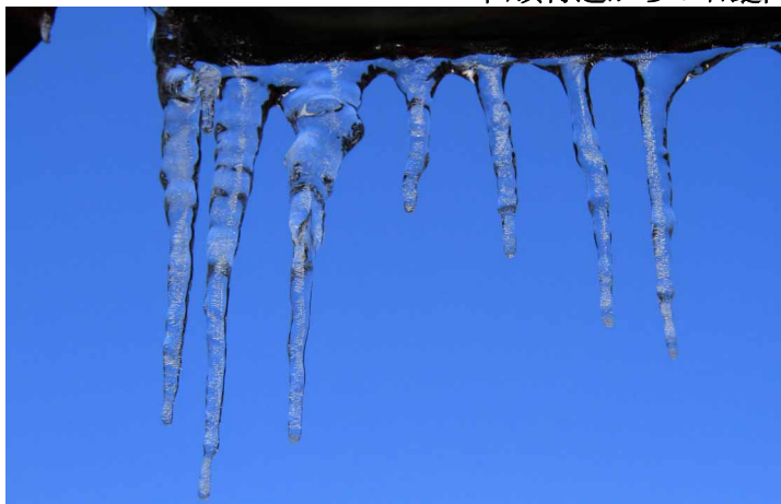
▲ 透き通った青空と氷柱

今回は今年最後の雪を楽しみに笹ヶ峰のお隣「沓掛山(くっかけやま)」に行ってきました。もともと雪の多い笹ヶ峰周辺だけあって、今回も笹と雪が織り成す景色を楽しみながら進んでいきました。頂上に着くと冬特有のスッキリとした視界で石鎚山系を見渡せる、大パノラマを楽しみました。天気もいつも通りの晴天に恵まれて、これからが本番の冬山の良い予行演習になりました。