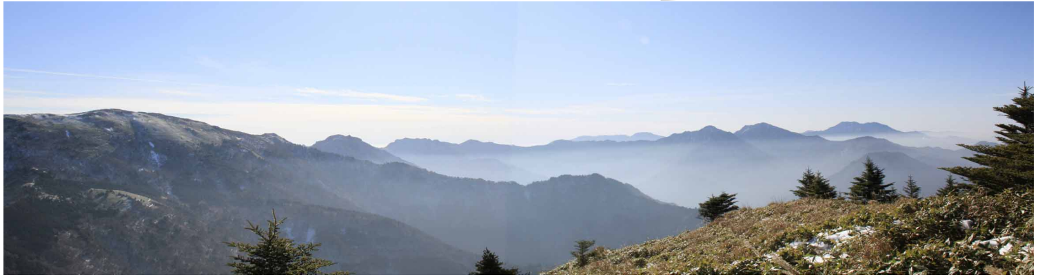
▲ 頂上からのパノラマ