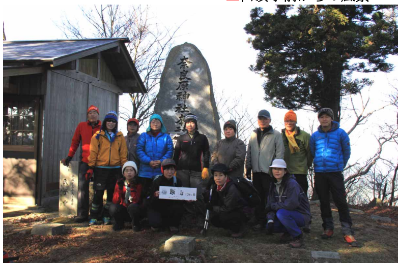
▲奈良原山山頂にて