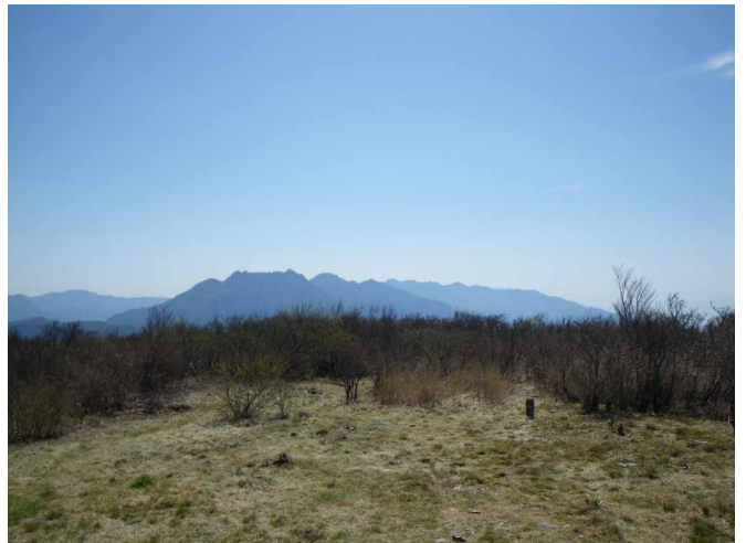
▲ ニツ岳から西赤石山へと続く山並み

春になるとカタクリの花が山頂周辺で咲く赤星山へと、ちょうど芽吹きはじめた新緑と共に楽しみに行ってきました。