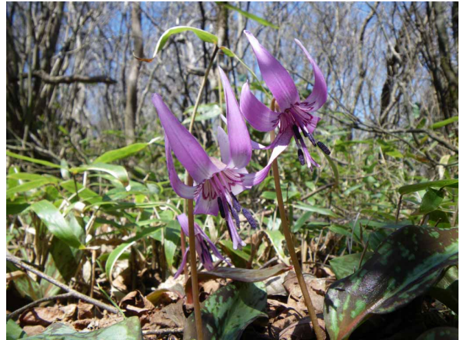
▲ 快晴に気持ちよさげなカタクリ