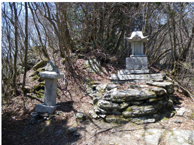
▲ ひっそりとたたずむ赤い星の祠