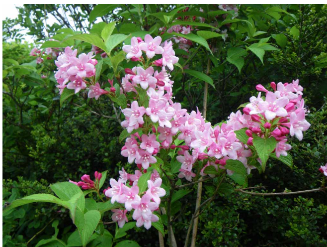
▲ ちょうど花盛りのウツギの花