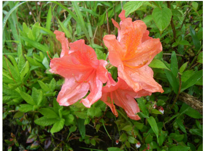
▲ 雨で色を鮮やかにしたツツジの花