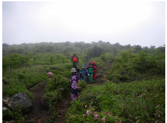
▲ 花々を楽しみながらノンビリ歩き