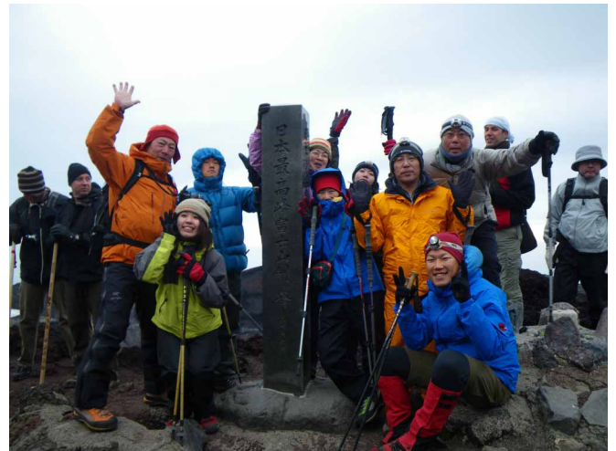
▲ 日本最高峰、富士山山頂にてバンザイ！！

日本最高峰3776mの頂へ立とうと富士山へといってきました。梅雨の影響か、富士宮に到着した日は大雨、浅間大社に参拝して登頂&天候祈願をお願いしました。