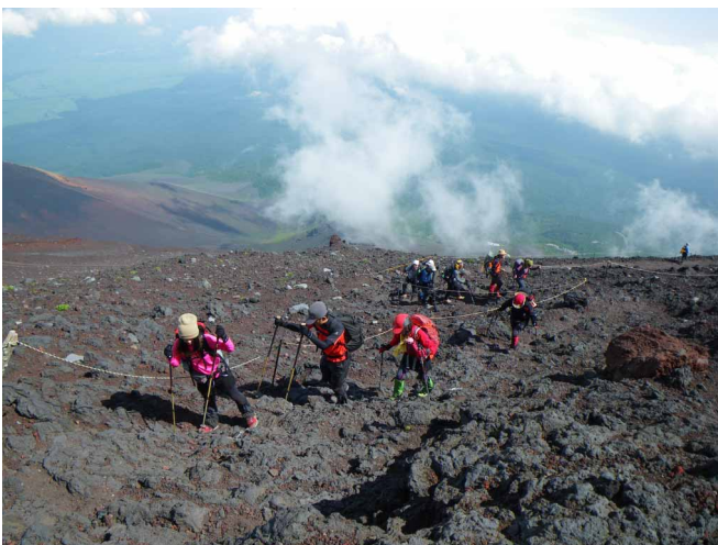
▲ 雲上の登山道を頑張って登ります

翌日、願いがかなったか、真っ青に晴れ渡る五合目を意気揚々と出発です。急がずゆっくりボチボチとを合言葉に、火山独特のガレガレの景色の中、一合一合標高をあげていきます。時折、強い風の吹くこともありましたが、無事この日の宿、万年雪荘に到着し、温かなもてなしを受けてゆっくりと体を休めました。まだ真夜中の2時にアタック開始です。長く続くヘッドライトの列に加わり御来光目指して歩いていきます。東の空がうっすらと白み始めた頃、浅間大社奥宮へたどり着き、赤色から黄色に変わる空に光線が差して御来光の登場です。御来光を見た後は、剣ヶ峰へ向い最高峰の頂へ皆で立ちました。幸運にも梅雨の晴れ間に当たり、ご来光まで楽しめた富士登山となりました