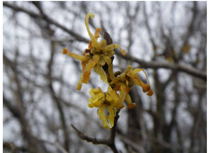
▲ 登山道沿いに咲くマンサクの花

07:00・今治発 09:00・高藪登山口 10:00・主尾根 11:30・平家平山頂 12:40・冠山 14:30・平家平 15:30・主尾根 16:30・登山口 18:30・今治着