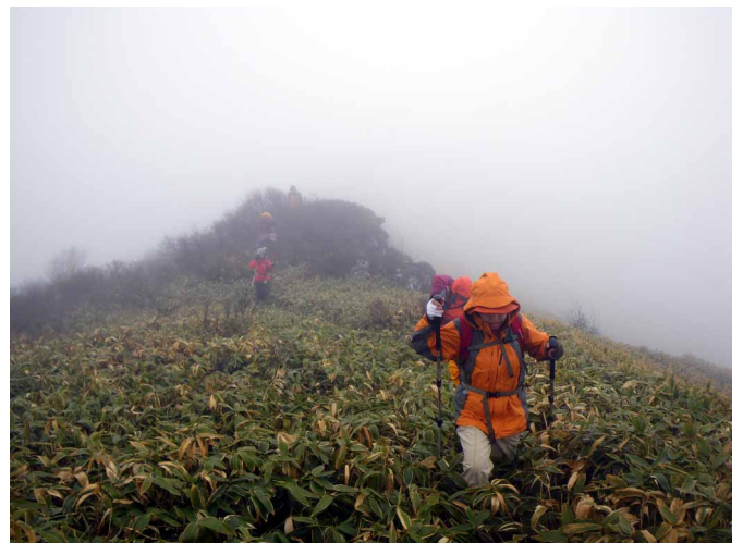
▲ 笹原を歩いて冠岳へ