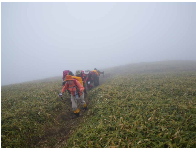
▲ 笹原へ出たらもう一息で平家平

名の通り山頂がなだらかで平な笹原の平家平へと、春の気配を楽しんでみようといってきました。