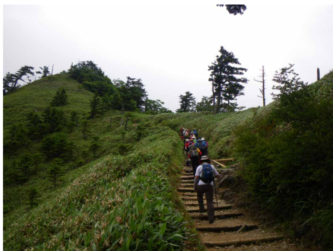
▲ 土小屋から、石鎚山を目指して