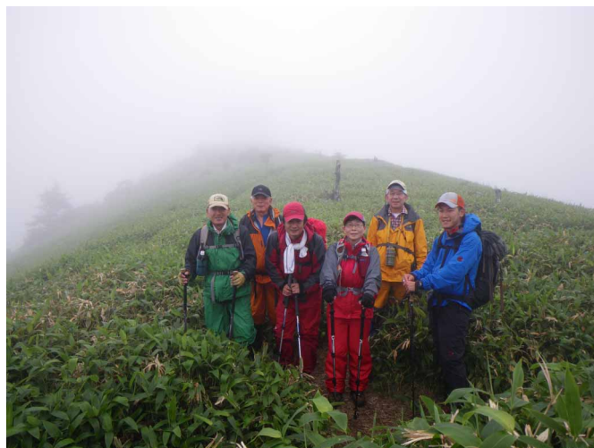
▲ 霧につつまれた堂ガ森にて