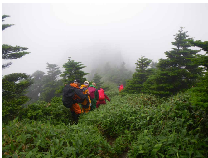
▲ 深い笹の縦走路を二ノ森へ

夏山の縦走を楽しんでみよう、石鎚、土小屋から堂ガ森、保井野まで歩いてきました。梅雨明け宣言を受け、青空を期待していた登山口では、ちょっとはつきりしない空模様？回復を期待しつつ出発、石鎚山への道のりをたどり3の鎖の分岐で二ノ森へと向かって行きます。石鎚への道を離れると、さっきまでの賑わいが嘘のような静かな道を歩いて二ノ森へと到着、石鎚は濃い霧の中に隠れて見えず、残念でした。一息入れたら、後半戦に向けスタート。なだらかな笹原の続く稜線を歩いていると大きな淡いピンクのササユリの花達が出迎えてくれ、道中を楽しませてくれます。堂ガ森へ到着し、くだりの本番の始まりです。足元に気を付けながら頑張って下り保井野登山口へ到着しました。ちょっと期待した天気とは言えませんが、一杯咲いたササユリと笹原の道を楽しんで歩いた縦走となりました。