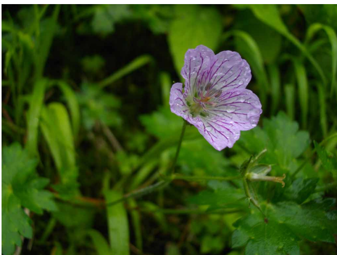
▲ 登山道に咲くフウロの花