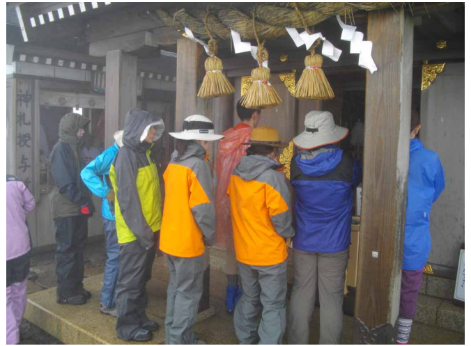
▲ 山頂神社に皆でお参り