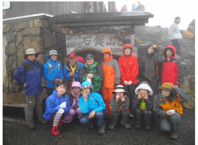
▲ 頑張って登った石鎚山山頂にて