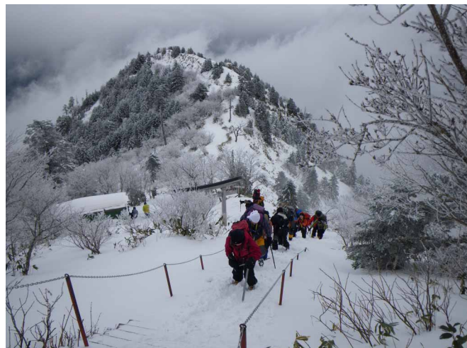
▲ 深雪の中を一步一步、山頂目指して

07:00・今治発 08:50・石鎚ロープウェイ下谷駅 09:40・成就社 11:00・前社森 11:40・夜明峠 13:00・石鎚山山頂(昼食) 14:45・前社森 16:00・成就社 17:00・石鎚ロープウェイ下谷駅 18:30・今治着