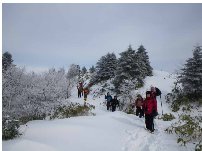
▲ 夜明かし峠に着けば青空が！