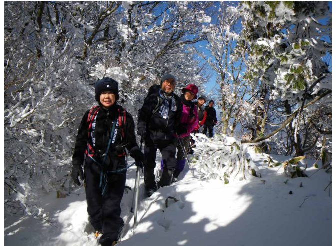
▲ 青空と白の景色を楽しみながら

07:00・今治発 08:30・唐岬ノ滝登山口 09:30・石割峠 11:00・石墨の別れ 12:00・石墨山(昼食) 13:50・石墨の別れ 14:30・石割峠 15:00・唐岬ノ滝登山口 17:00・今治着