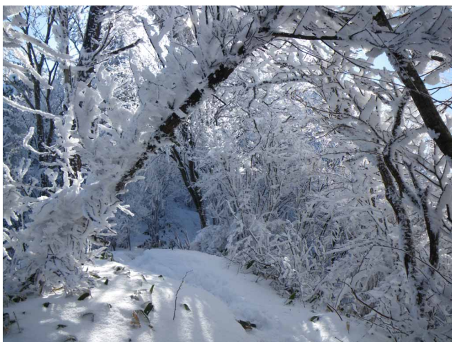
▲ 真っ白なトンネルの道歩き

だんだん上が明るくなったところで石墨の別れに到着、キラキラと輝く白の世界が待ち構えていてくれました。そこから山頂へと続く道沿いには、まさしく霧氷のトンネルとなった木々がいっぱい、時折木々の間から雪化粧した石鎚山系が見え最高です。山頂では、柔らかな日差しに恵まれ、ポカポカと気持ちいい昼食を楽しむことができました。天候に恵まれ、青と白のコントラストを楽しめた山歩きでした。