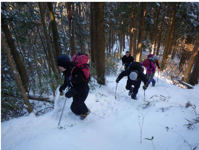
▲ 急な登りを頑張って!!