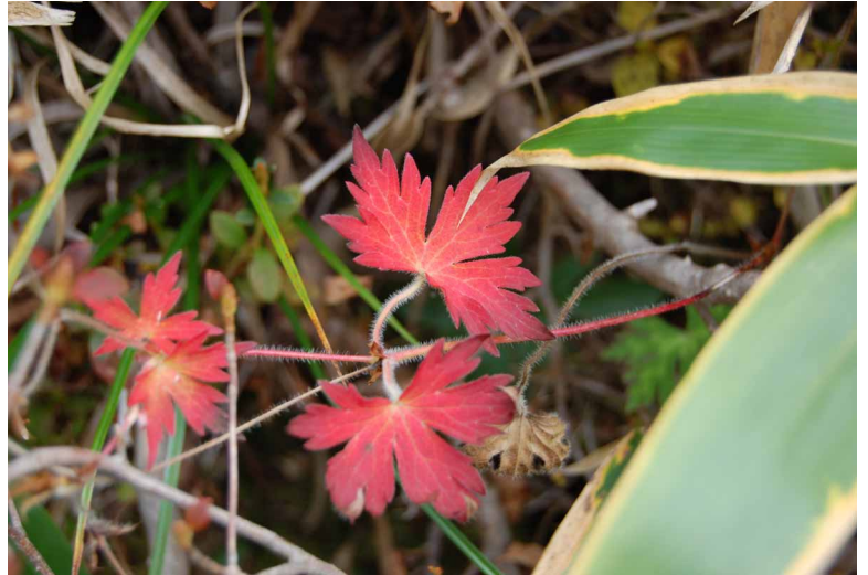
▲ 筐の中の小さな紅葉

07:00・今治発 09:15・瓶ヶ森林道 10:10・瓶ヶ森登山口 10:40・瓶壺 12:10・女山 13:30・男山 17:00・今治着