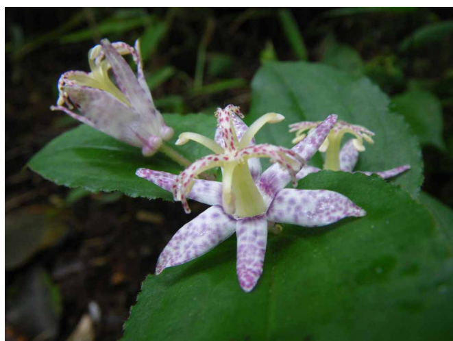
▲ 綺麗に咲いていたホトトギスの花たち