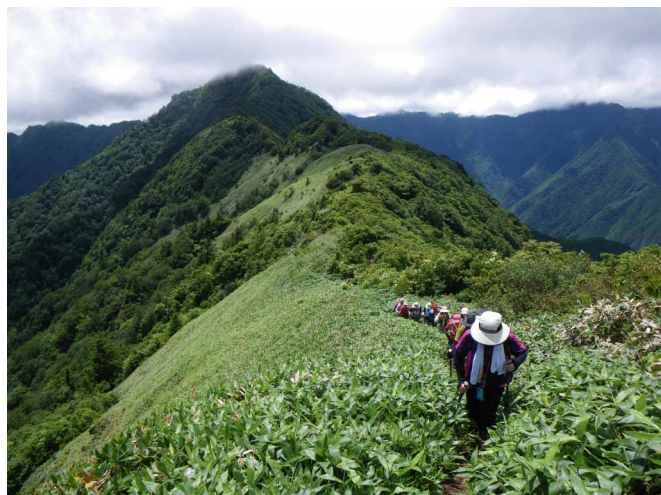
▲ 寒風山を背に、笹ヶ峰へ続く縦走路

06:00・今治発 08:00・旧寒風山トンネル登山口 09:10・桑瀬峠 10:45・寒風山(昼食) 13:30・笹ヶ峰 14:50・丸山荘 15:30・宿 16:30・林道登山口 18:30・今治着