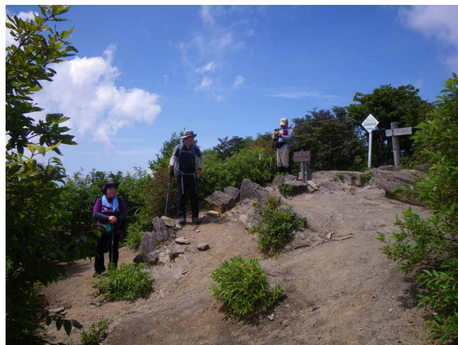
▲ 青空が近くに見えた西赤石山