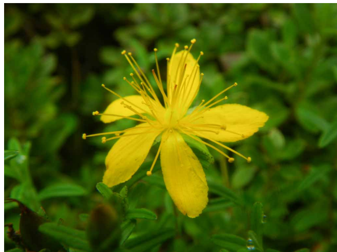
▲ 登山道沿いに咲いていたオトギリソウ

06:00・今治発 08:00・東平登山口 09:30・上部鉄道分岐 10:30・稜線 12:00・西赤石山 14:30・上部鉄道分岐 14:40・銅山峰ヒュッテ 15:50・東平登山口 18:00・今治着