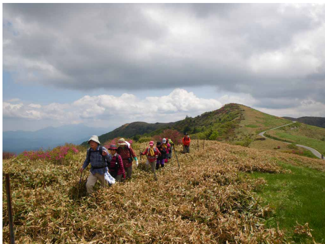
▲ なだらかに続く稜線歩き