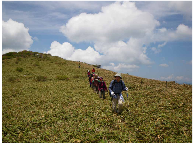
▲ 草原のような笹原歩きを楽しみつつ

07:00・今治発 09:30・道の駅みかわ 10:30・大川嶺登山口 11:00・大川嶺（昼食） 12:40・笠取山 14:30・登山口 15:00・道の駅みかわ 18:00・今治着