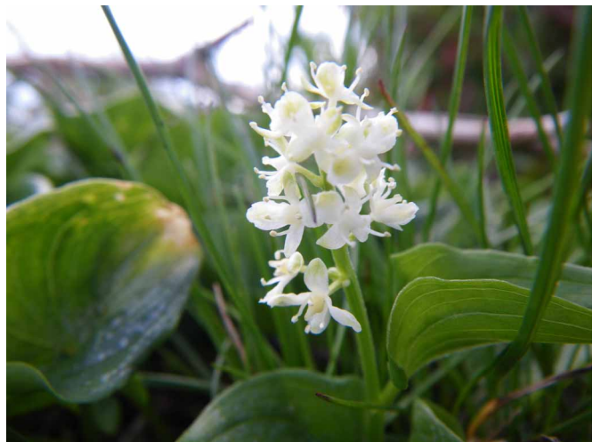
▲ 牧草地に咲いていたマイヅルソウ