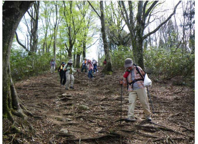
▲ 気持ちのいいブナ林の尾根歩き