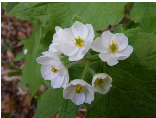
▲ 純白の花が美しいサンカヨウ

秋は紅葉、春は花々の楽しめる岡山森林公園へ、新緑とともに春の花を探しに行ってきました。管理棟で今の花の状態を聞いて出発です。ミズバショウやザゼンソウといった珍しい花が出迎えてくれテンションもアップ！！