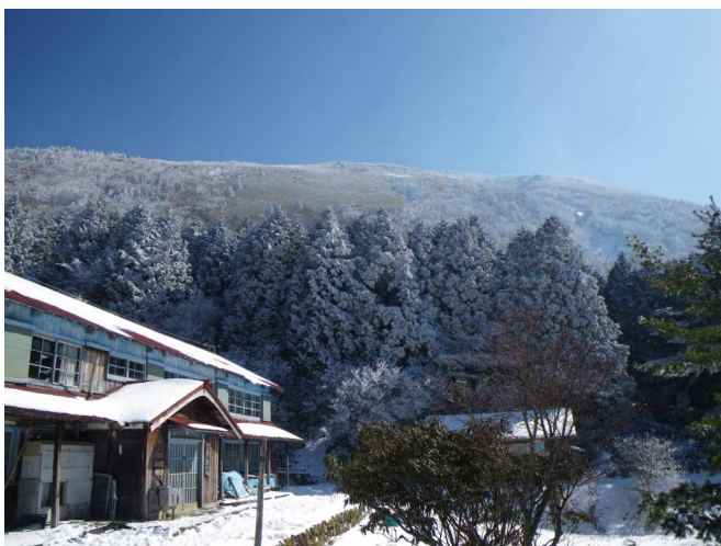
▲ 真っ青の空に浮かび上がる笹ヶ峰