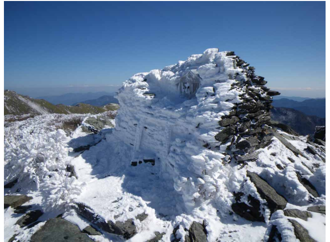
▲ 雪と風が作り出したオブジェ