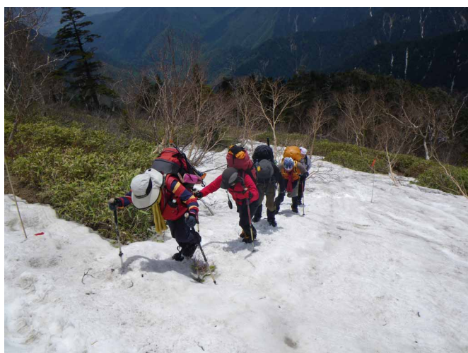
▲ 雪渓の残る登山道を頑張って

雪を稜線にいただく美しい北アルプスの姿と、独特の美しい山容の燕岳に雪フミに行ってきました。登山口となる中房温泉を澄み渡る青空の中出発。北アルプス有数の急登を、焦らず！急がず！登っていきます。第一、第二、第三、富士見とあるベンチがちょうどいい具合に現れて、休むのに助かります。夏には多くの人で賑わう合戦小屋も、まだひっそりとたたずんでいました。雪が多くなったので、ここからアイゼンを履き雪渓歩きのスタート、トレースをしっかりと踏みしめながら尾根へと上がると、蝶ヶ岳へと続く大天井岳や情念岳の雪をたっぷり載せた山並みをはじめ、天を突き刺す槍ヶ岳の勇姿が現れて、最高の景色を楽しませてくれました。山荘から燕岳へはもう一息、とってもユニークな形の奇岩の中を通り抜け、山頂へと到着です。北アルプスの雄大な景色と優美な花崗岩の造形が広がっていました。天候にも恵まれ、春の雪山歩きと雪景色をとっても楽しめた山歩きとなりました。