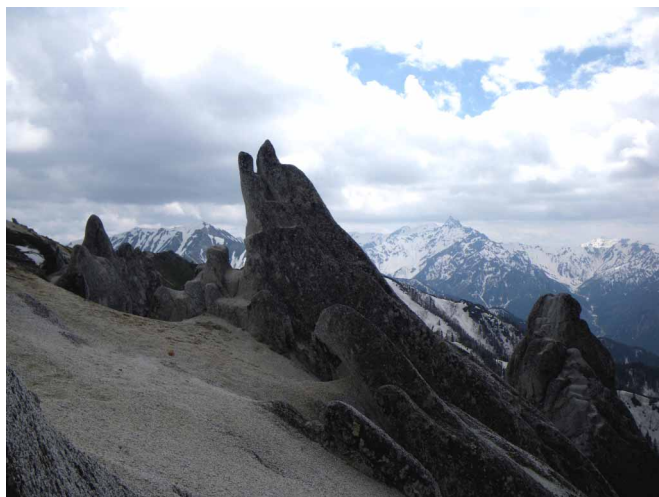
▲ 北アルプスを背にイルカ岩の姿