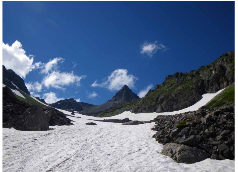
▲ 多く残る雪渓と槍ヶ岳