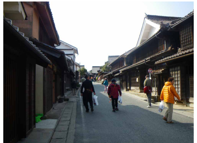
▲ ベンガラで栄えた町並み散策

春の到来を告げるように、花開くユキワリソウ、雪解けとともに花をさかせる、可愛い花に会いに行ってきました。