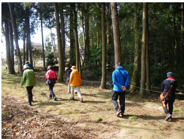
▲ 花を見ながらノンビリ歩き