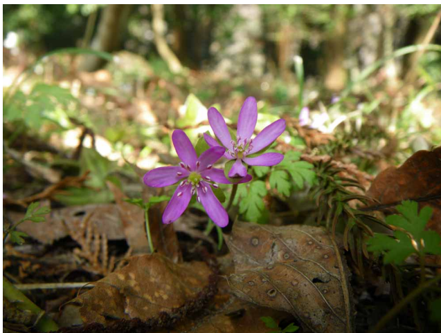
▲ カルスト台地に咲くユキワリソウ