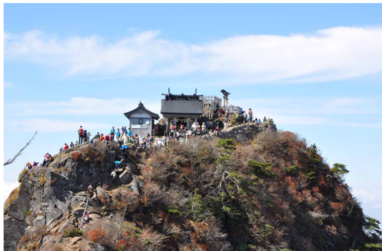
▲ 登山客でいっぱいの石鎚頂上