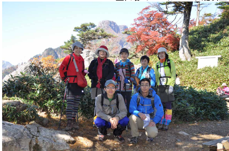
▲ 石鎚山と紅葉をバックに

紅葉で鮮やかに色づいた石鎚山に行ってきました。 紅葉もベストシーズンを迎えているので多くの登山客で渋滞していましたが、ゆっくり周りの景色を楽しみながら歩いて山頂に到着しました。 晴天の秋空の中石鎚山を満喫できた登山になりました