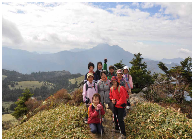
石鎚山をバックに皆さん笑顔

「山の紅葉を眺めながら、ゆっくりとササ原を歩く、そして大自然の中で美味しいコーヒーを楽しみませんか〜」の呼び声にお集まり下さった皆さんと《瓶ヶ森》に行きました。