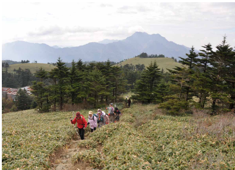
▲ 見晴らしのいい笹原の登山道を歩きます