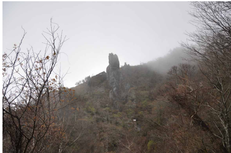
▲ ガスの切れ目から見えた大剣

今回は剣山を越えてササ原と綺麗な山容の「次郎笈 (じろうぎゅう)」に行ってきました。