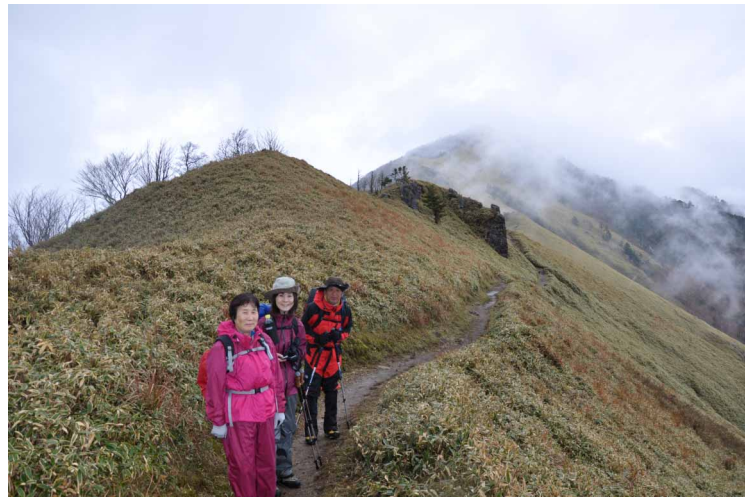
▲ 稜線から次郎笈をバックに