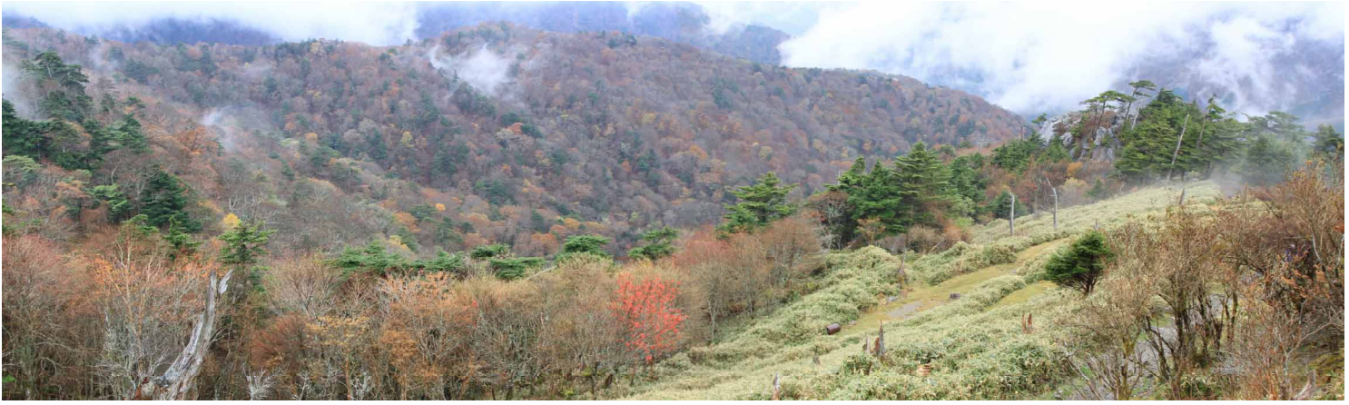
▲ 西島駅からの景色