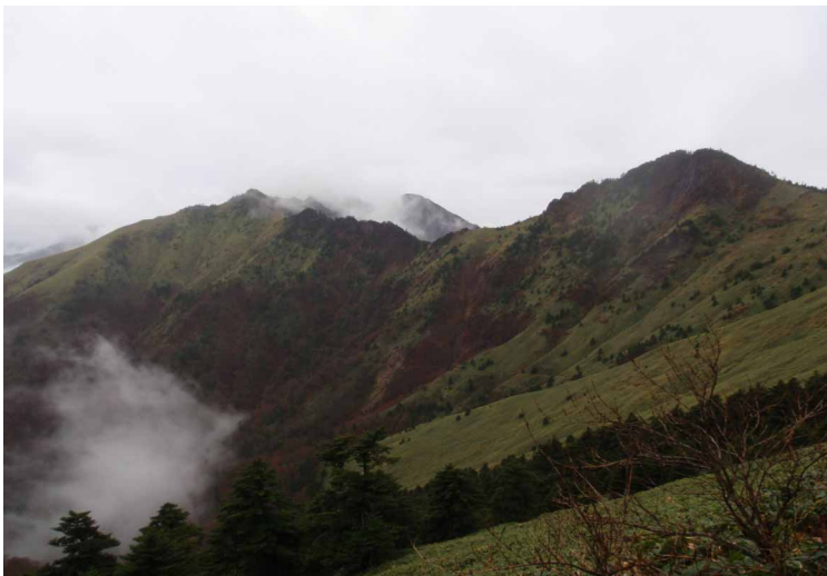
▲ 雲の切れ目からのニノ森方面