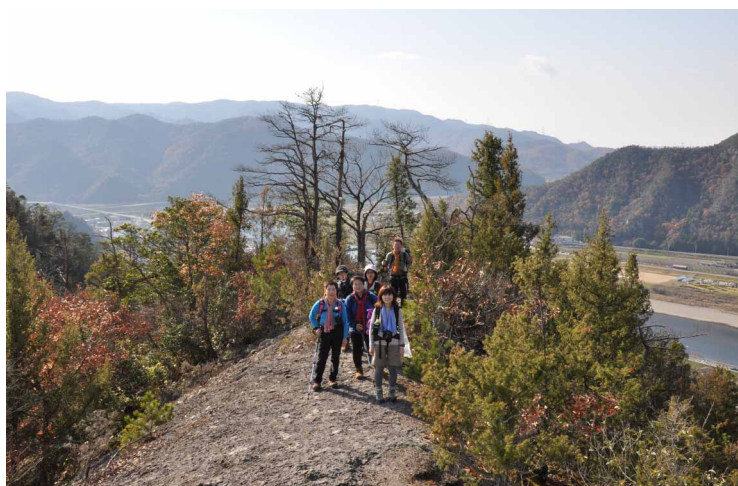
▲ ポカポカ陽気でスタート