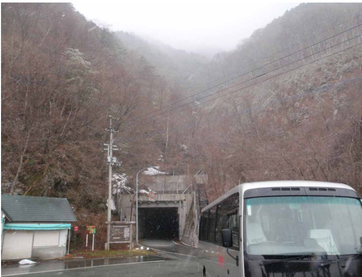
▲ 登山口周辺はまだ冬景色です