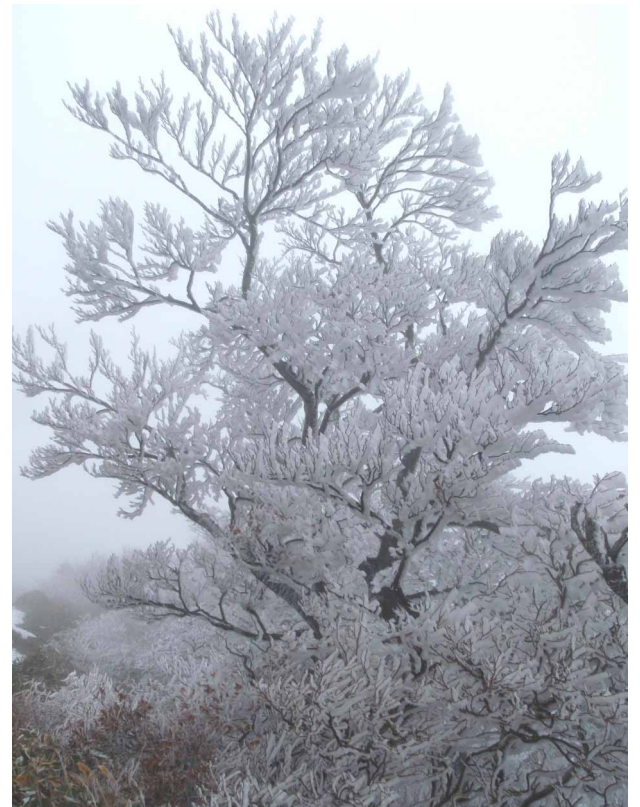
▲ この季節には珍しい立派な霧氷