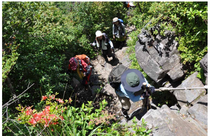
▲ 難所を慎重に登ります