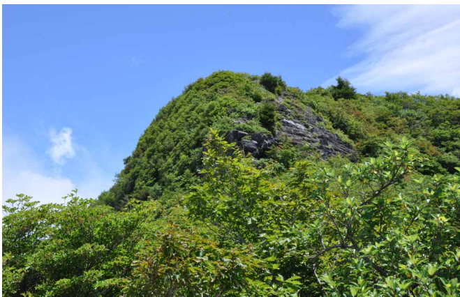
▲ 夏山らしい景色になりました