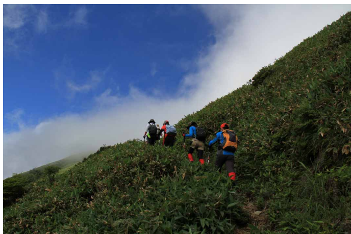
▲ 笹原の稜線歩きを楽しみます

待ちに待った《山キャンプ》皆この日を楽しみに準備を進めてきました。その期待に答えるかのような青空の下スタート、まずは足慣らしに伊予富士～東黒森まで尾根歩きの後ランチタイム。午後は、瓶ヶ森キャンプ場にてテントの設営、そして今夜のメイン、キーマカレー作りと手際よく楽しみながらの宴会でしたが強風の為(・・)早過ぎる撤収となりました