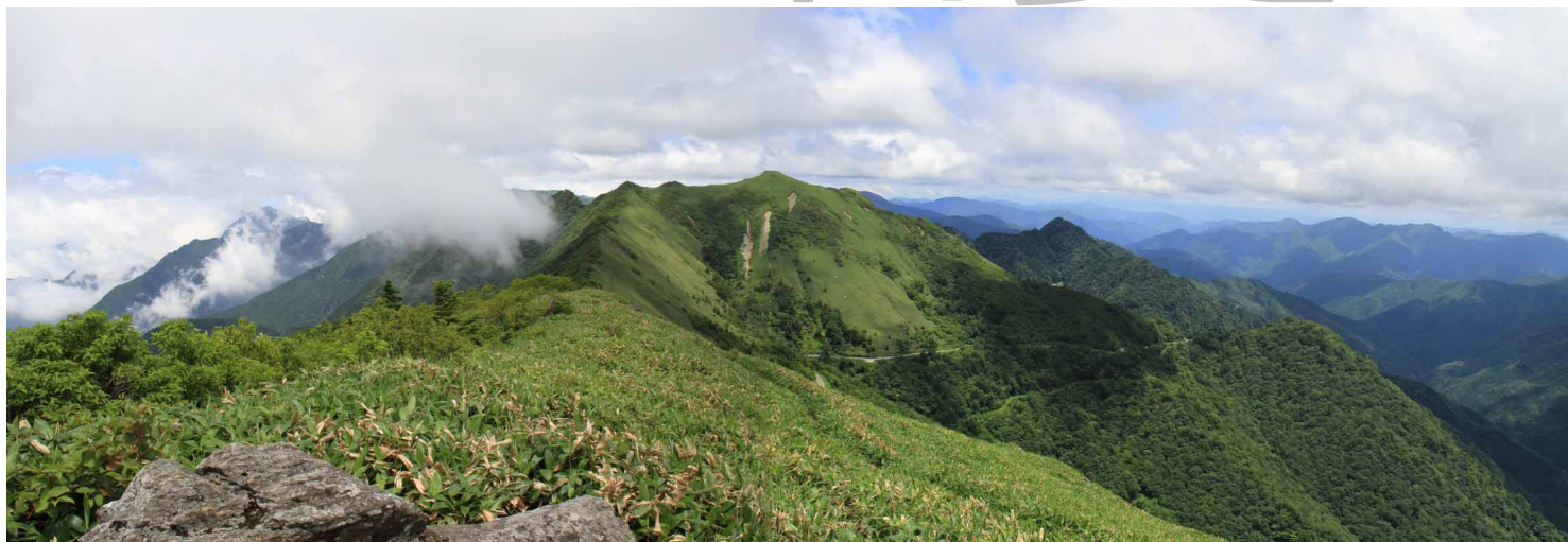
▲ 東黒森からの伊予富士