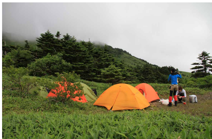
▲ テントを張ってディナーの準備中

待ちに待った《山キャンプ》皆この日を楽しみに準備を進めてきました。その期待に答えるかのような青空の下スタート、まずは足慣らしに伊予富士～東黒森まで尾根歩きの後ランチタイム。午後は、瓶ヶ森キャンプ場にてテントの設営、そして今夜のメイン、キーマカレー作りと手際よく楽しみながらの宴会でしたが強風の為(・・)早過ぎる撤収となりました