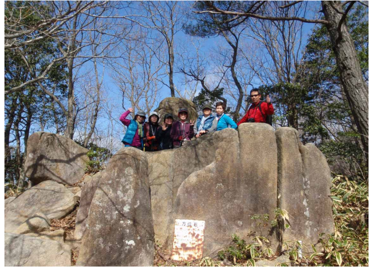
▲ 鬼叫山山頂の方位石にて

06:00・今治発 09:30・葦嶽山登山口 10:10・葦嶽山山頂 10:30・鬼叫山山頂 13:15・節分草群生地 14:30・町並み散策 18:20・今治着