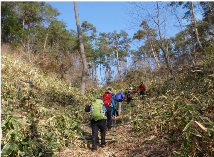
▲ 綺麗に管理された葦嶽山の登山道