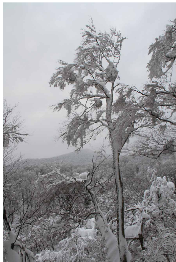
▲ 立派な樹氷が無数にあります