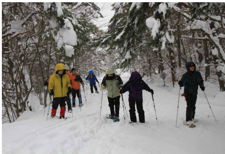
▲ 雪まみれの道をスノーハイク