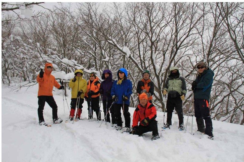
▲ スノーシューを満喫してみなさんと一枚