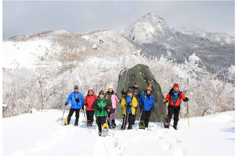
▲ 石鎚山系をバックにみなさんと