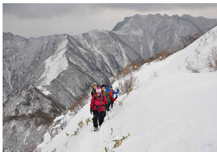
▲ 深い雪の斜面は慎重に

《寒風山》その名の如く冷たい風が吹く地元の見慣れた山は、新雪を纏い厳冬の時を歓迎するかのようにはしゃいでいました。今回お天気は曇りでしたが、風の心配は無く順調に雪山歩きと冬景色を楽しむ事が出来ました。