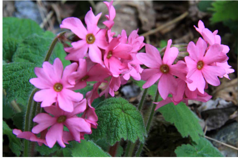
▲ シコクカッコウソウ