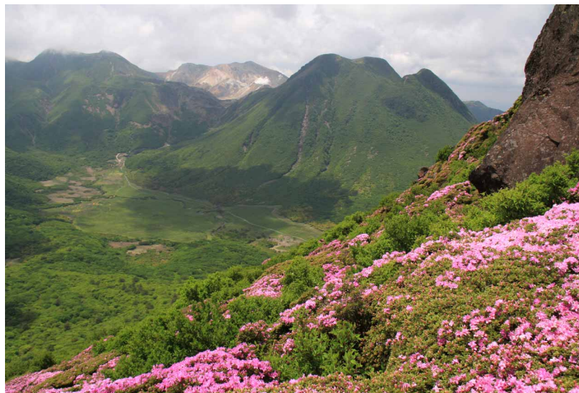
▲ 平治岳からの景色