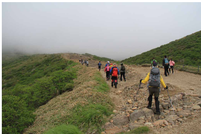
▲ 久住山への登山道

山並をピンク色に染めるミヤマキリシマを求めて久住山を訪ねました。火山群特有の登山道はゴロゴロと滑りやすく中々大変でしたが、山頂の展望そして満開のミヤマキリシマは素晴らしい景色でした♪