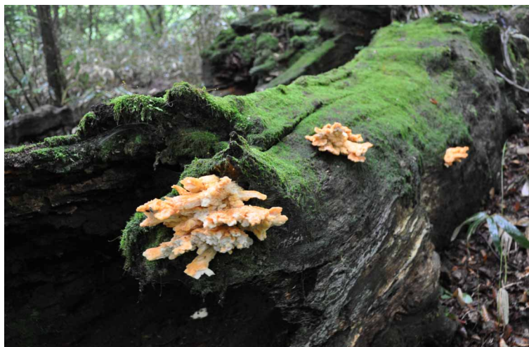
▲ 倒木に自生したキノコ

07:00・今治発 09:30・登山口 12:10・笹倉湿原 15:30・登山口 18:30・今治着