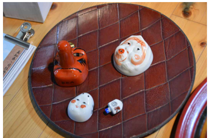
▲ 可杯 (べくはい)

修験道の修行の地として開山された横倉山は安徳天皇の伝説の地としても有名です。又その植生の多さからもました♪