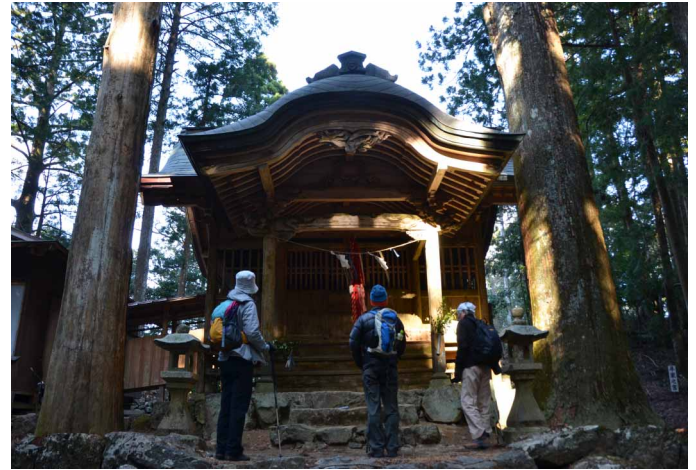
▲ 厳粛な雰囲気と歴史ある建物