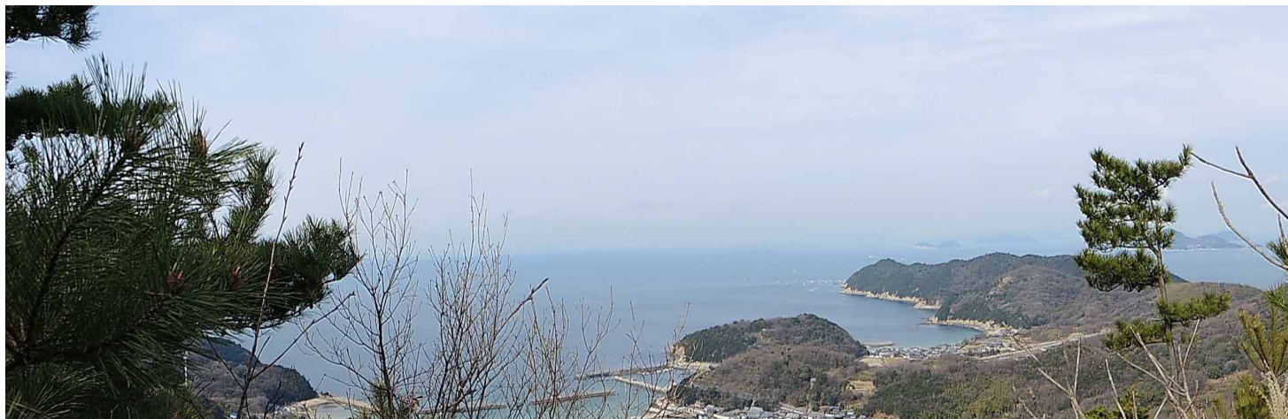
▲ 山頂からの瀬戸内海