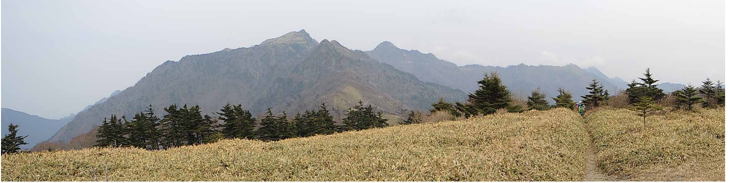
▲伊吹山からの瓶ヶ森方面