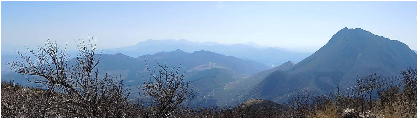
▲鶴見岳から久住山方面