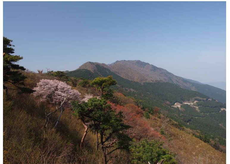
▲ 鋸山から豊受山方面

春と聞けば、先ずカタクリの花ピンク色の羽を広げたような可憐な花に会いに訪ねた鋸山は、カタクリ、アケボノツツジ、ヤマザクラと花盛りで綺麗でした♪