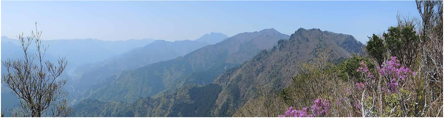
▲ 鋸山から石鎚山方面