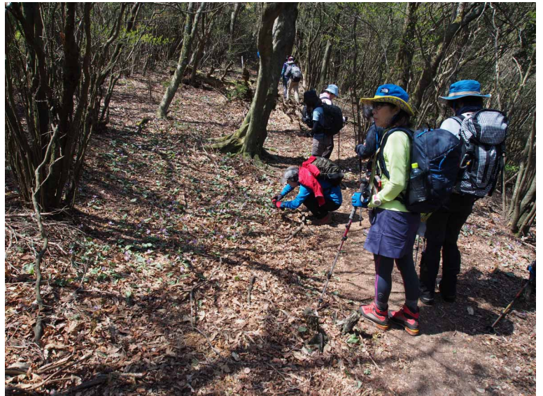
▲カタクリ群生地での撮影会

07:00・今治発 09:00・登山口 10:00・鋸山山頂 12:00・豊受山山頂 15:00・鋸山山頂 15:40・登山口 17:30・今治着