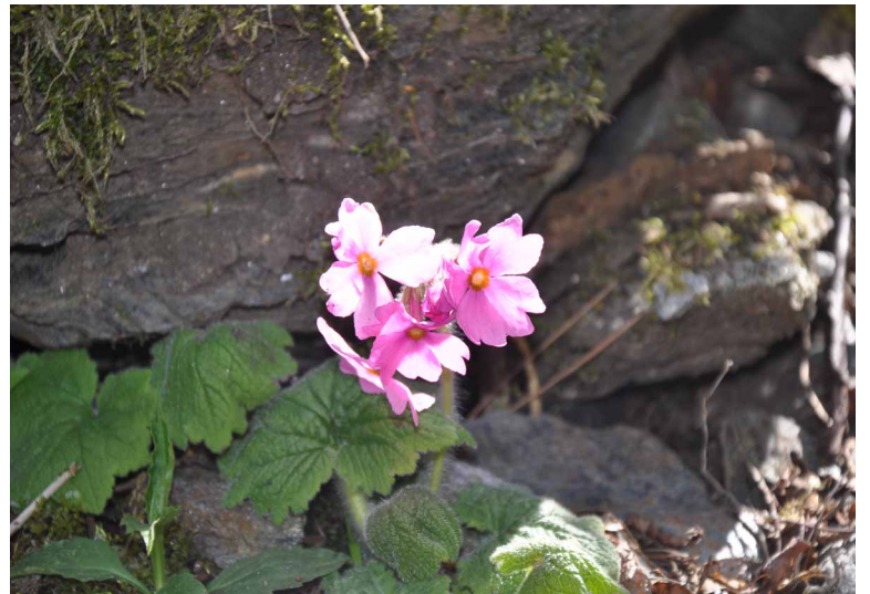
▲ シコクカッコウソウ

緑輝く新緑の森を抜け、見事に咲いたヒカゲツツジの花に励まされながら岩場の多い登山道を登りました。西赤石山頂は見渡す限りの大パノラマで最高でした♪