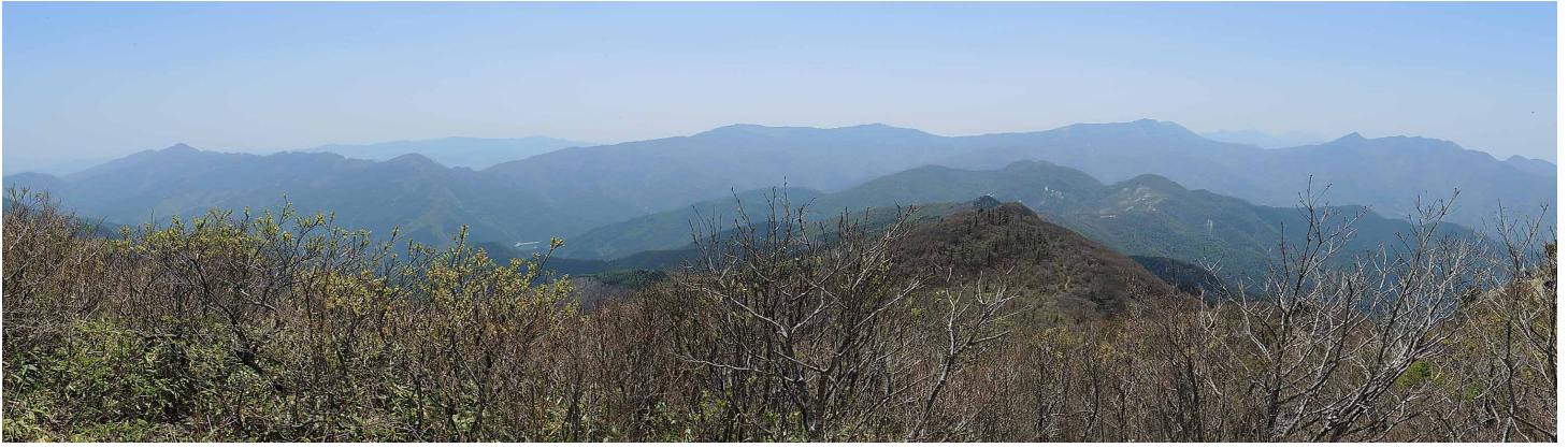
▲赤石山系からのパノラマ