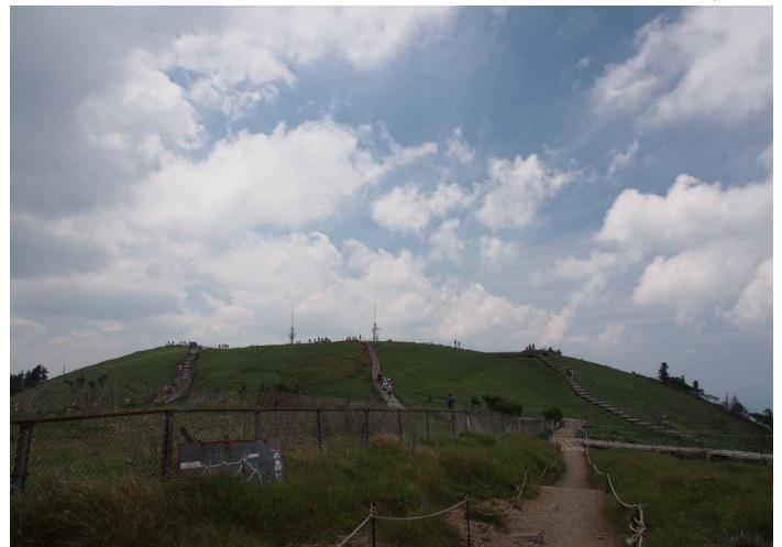
▲ なたらかな剣山山頂