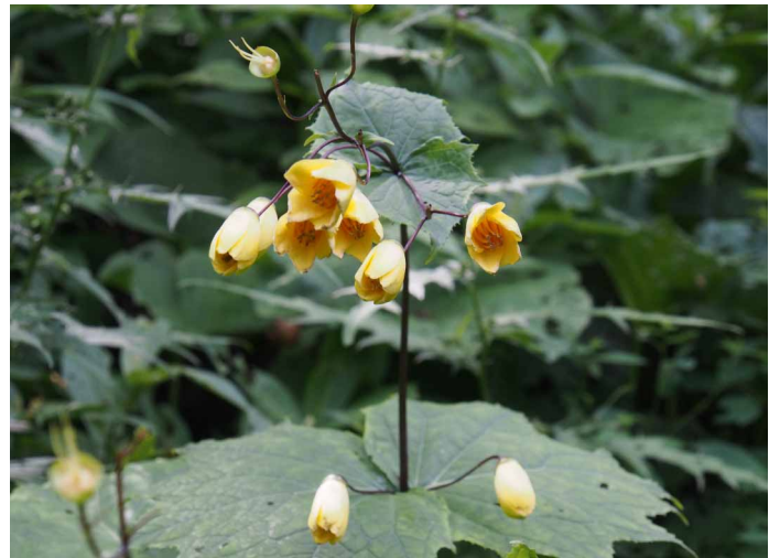
▲ キレンゲショウマ