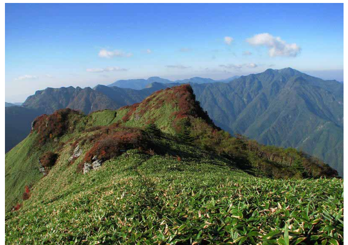
▲ 晴天時の山頂からの展望

連日の大雨で縦走は諦め《伊予富士》と《寒風山》の2チームに別れての山行です。雨に濡れた登山道は滑りやすいので気を付けて、それぞれに初秋の山を楽しみました。山はもう秋でした♪