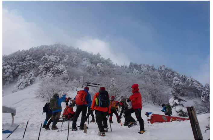
▲ 山頂まであと一息