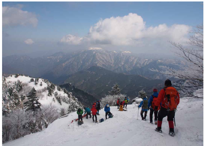
▲ 瓶ヶ森を眺めながら下山