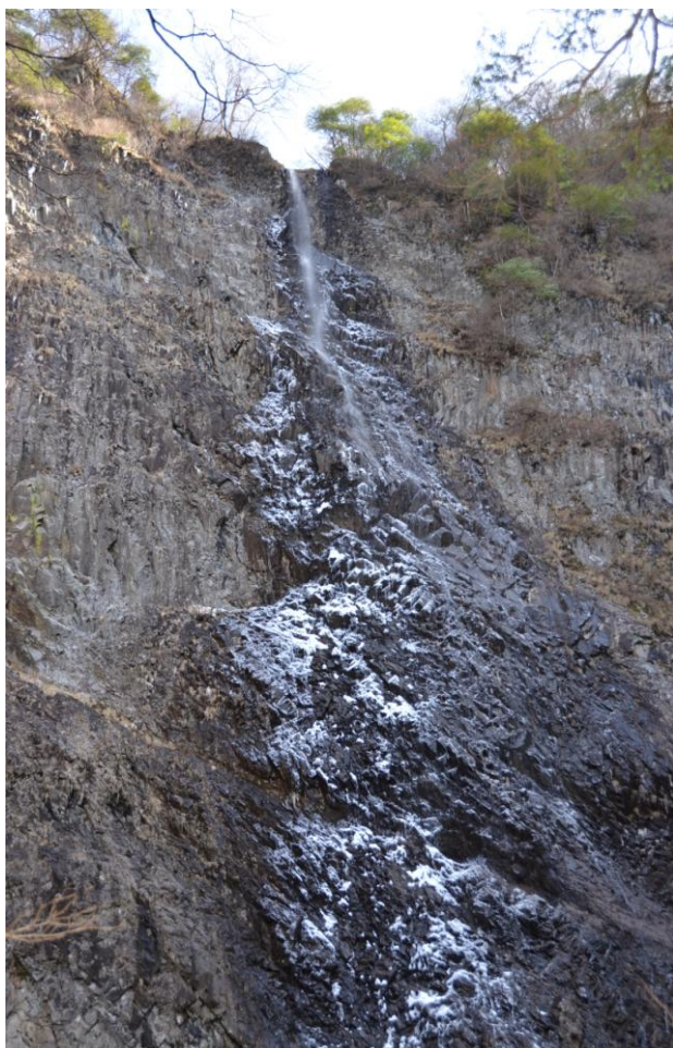
▲ 凍り始めた高瀑の滝