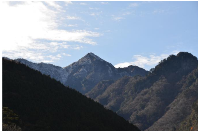
▲ 途中からの西黒森

07:00・今治発 10:30・登山口 12:30・高瀑の滝 14:30・登山口 17:00・今治着