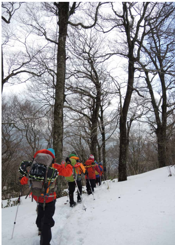
▲ 宿泊道具を持つての雪道歩き