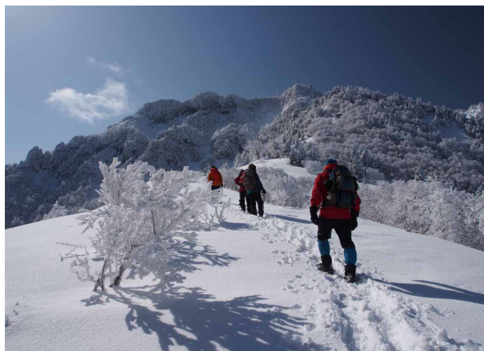
▲ 青空と雪の登山道

少し暖かい日が続いた後に寒波襲来。当然山は、大雪です！それでも燦々と降り注ぐ太陽のお陰で最高の青空の《石鎚山》雪を掻き分けながら安全第一で山行を楽しみました♪