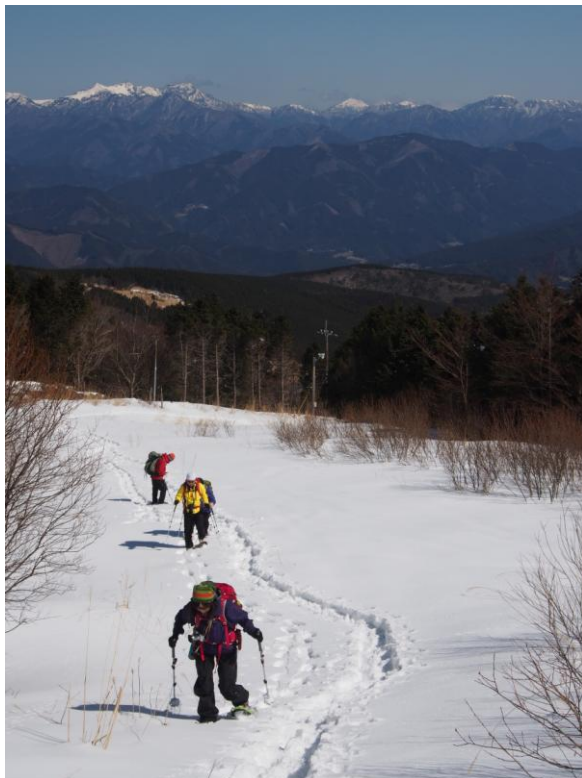
▲ 雪に埋もれた登山道