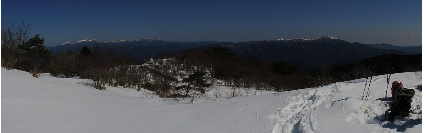
▲ 山頂手前からのパノラマ