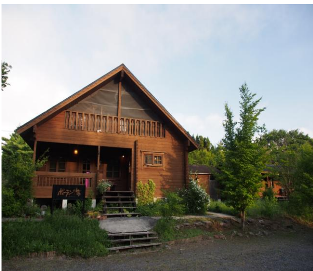
▲ お宿「ポーランの笛」