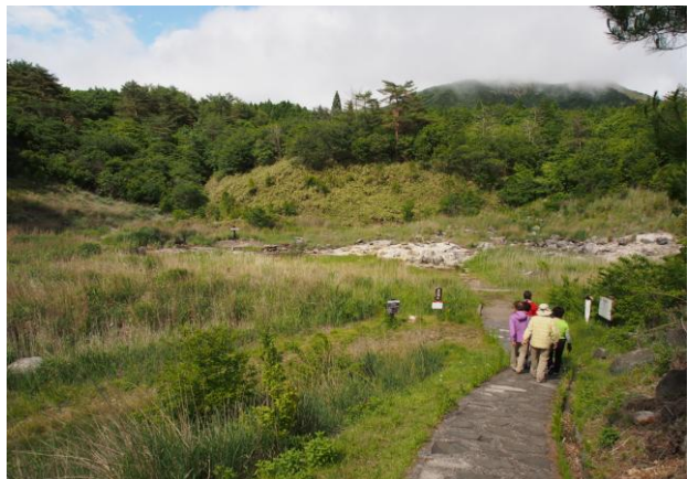
▲ 冷泉 雀地獄