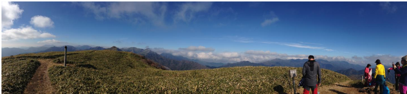
▲ 山頂からのパノラマ