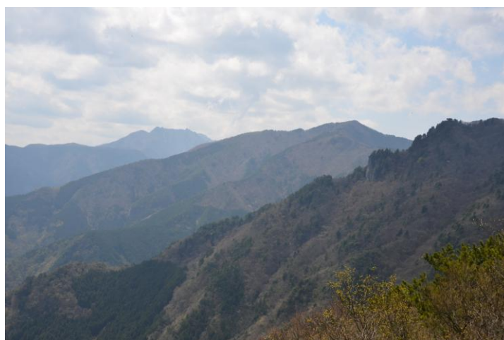
▲ 山頂から赤石方面