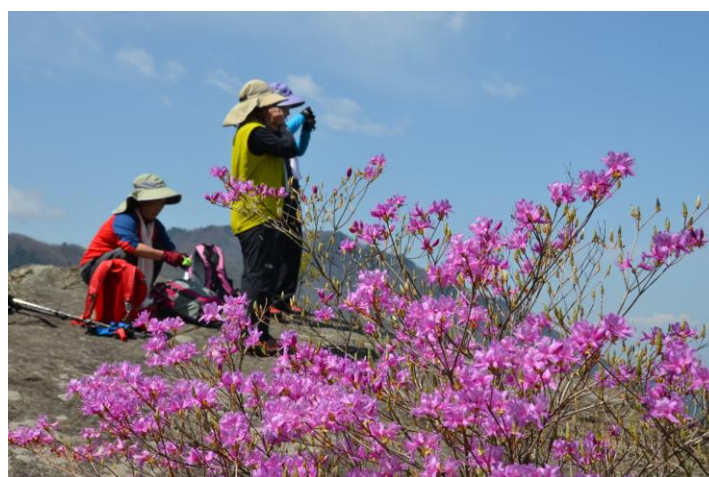
▲ 展望台の大岩にて

春の花は数あれどアケボノと一二を争う人気の花と言えばカタクリ！今日は可愛いカタクリに会いに《鋸山》を訪ねました。穏やかな春の日差しの中ゆっくり花を愛でながら歩きました♪